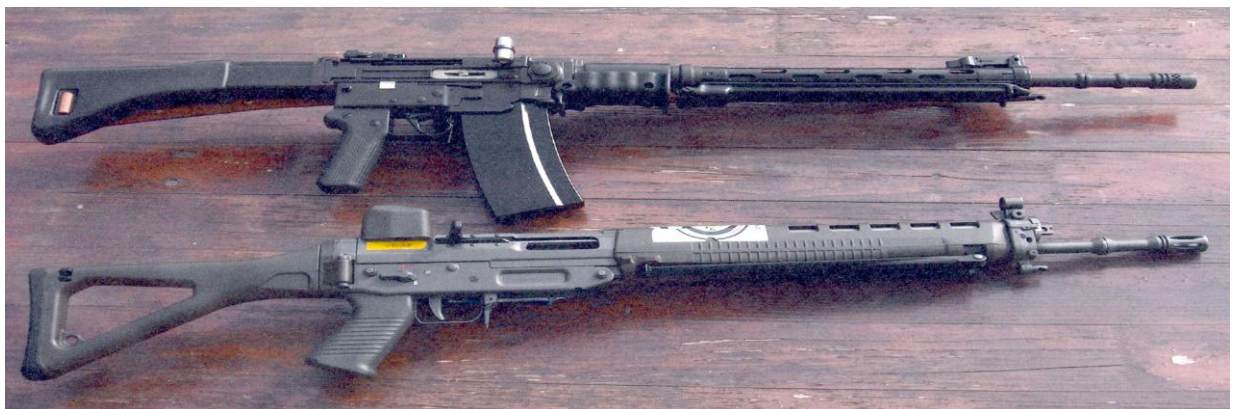
Figure 5 : Ces deux armes appartiennent à la famille Croisier, Ballens.

Le fusil, en arrière-plan, est dit d'infanterie. Il a été fabriqué à partir de 1811. Le coup part grâce à une pierre en silex 1 . C'est ce genre d'arme qu'on pouvait peut-être retrouver dans le tir d'Abbaye, à Ballens. La carabine, au premier plan, date des années 1820-1830 2 .