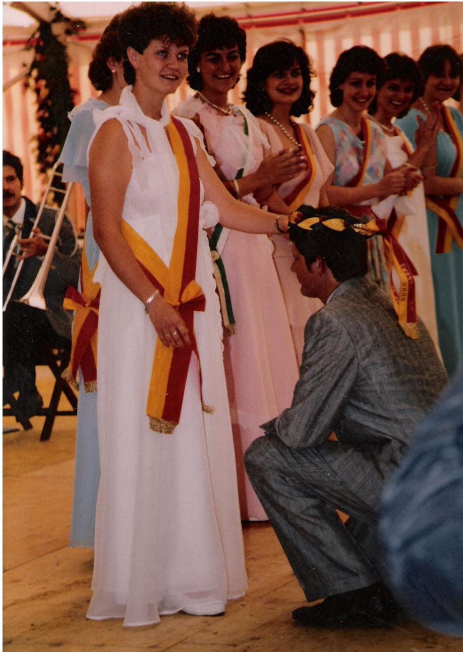
Figure 3 : Couronnement du roi du tir lors de la célébration de l'Abbaye, en 1987. Cette image provient d'un album de photos de la famille Croisier.

Cette fête est un rassemblement du village. Durant trois jours, on oublie toutes les querelles.