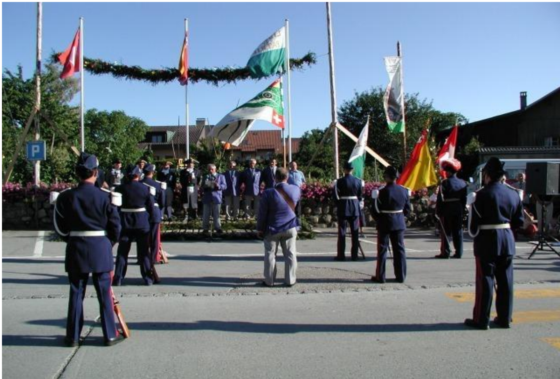
Figure 2 : Remise de la bannière lors de la dernière fête d'Abbaye, à Ballens, en juillet 2003.

Les trois meilleurs tireurs reçoivent chacun une couronne de laurier différente. Le meilleur des tireurs reçoit une couronne de laurier en or, pour le second, elle est en argent, celle du troisième est ornée de glands 2 .