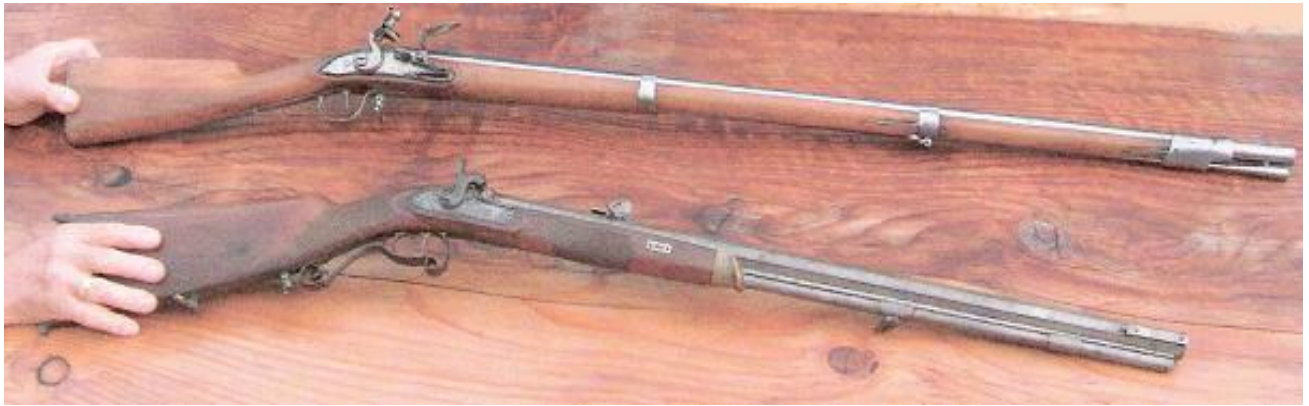
Figure 4 : Ces deux armes proviennent de la collection privée de Monsieur Walter Pfister, à Echichens.

Le fusil, en arrière-plan, est dit d'infanterie. Il a été fabriqué à partir de 1811. Le coup part grâce à une pierre en silex 1 . C'est ce genre d'arme qu'on pouvait peut-être retrouver dans le tir d'Abbaye, à Ballens. La carabine, au premier plan, date des années 1820-1830 2 .